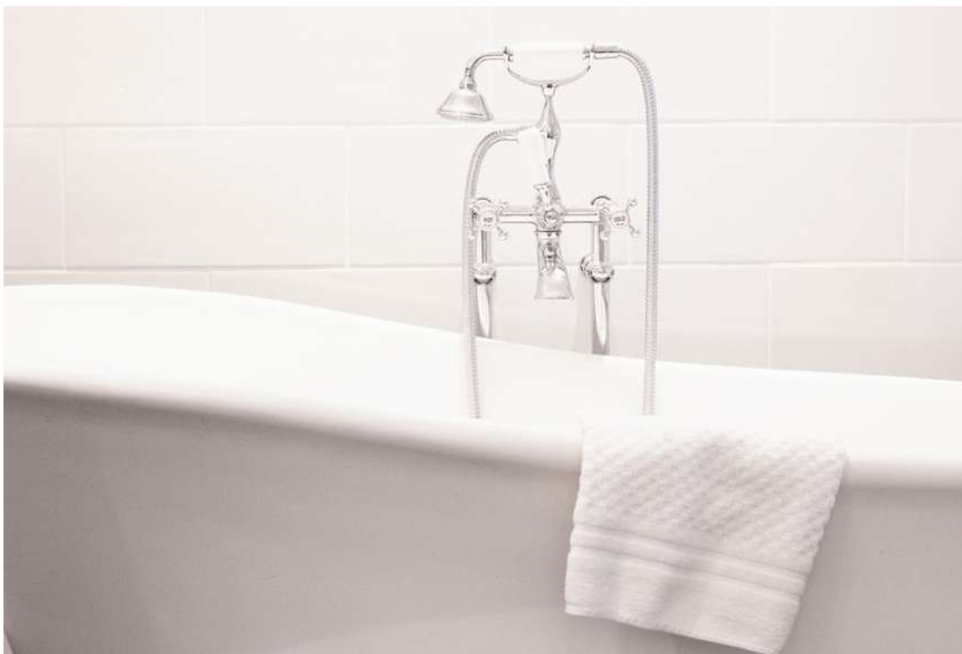
VAFFEL håndklæde STILREN SERIEN